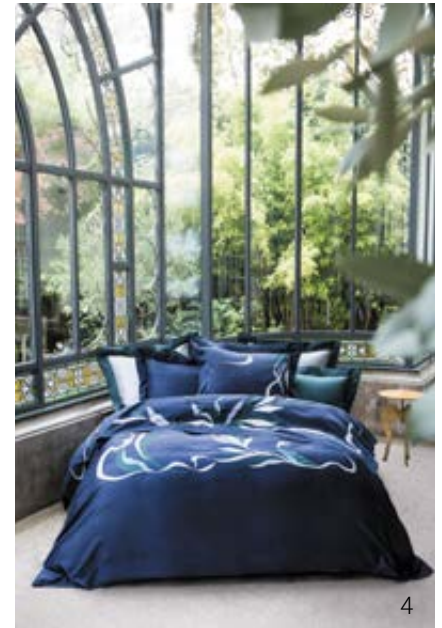
1. Delphine Beltran, directrice artistique. 2. et 3. Parures de lit «Solfège» avec bourdon et appliqué de satin coloré sur satin de coton. 4. Parure de lit «Daphnée» avec appliqué brodé main sur satin de coton.