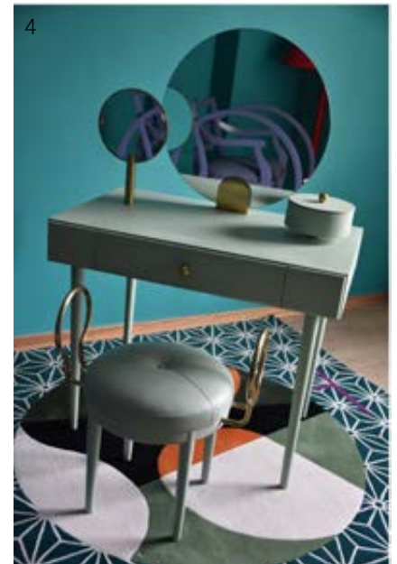
1. Thomas Dariel. 2. Suspensions «Little Eliah». 3. Tapis «Seoul by Day n°4», bougeoirs «CH 3» et «CH 4». 4. Tapis «Japanese Abstraction n°5», coiffeuse et tabouret «Rose Selavy».