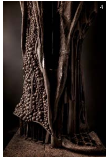
1. Patrick Roger. 2. Sculpture «La Fille du Nord», en aluminium. 3. Sculpture monumentale «Hippos», 2 tonnes, en aluminium. 4. Sculpture «Balzac», détail, en chocolat, Musée Rodin.